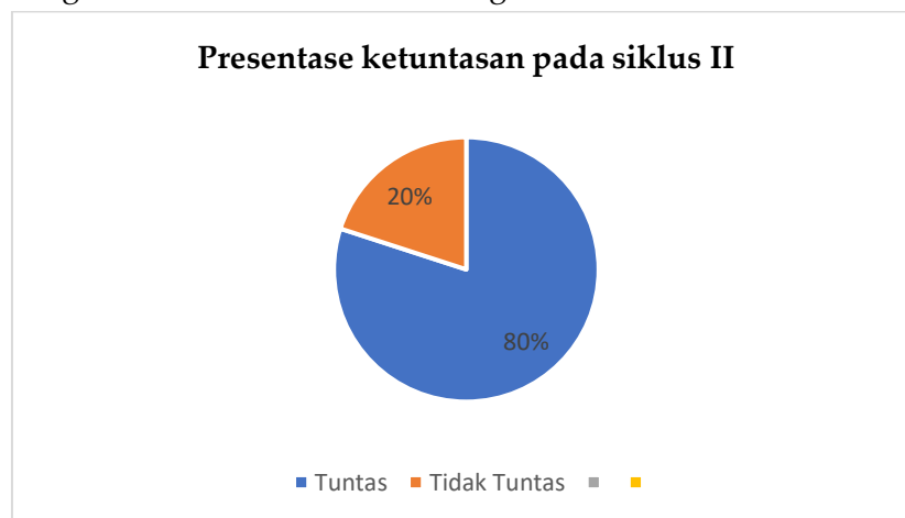
Gambar. 3 Diagram Presentase ketuntasan pada siklus II

Dapat disimpulkan bahwa siswa yang mencapai kriteria ketuntasan pada tahapan siklus I ke siklus II mendapatkan peningkatan presentase sebesar 20%. Guru mendefinisikan bahwa yang tuntas sebanyak 16 siswa (80%) dan yang tidak tuntas sebanyak 4 siswa (20%). Dalam bentuk diagram maka data tersebut sebagai berikut: