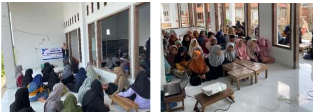
Gambar 2. Antusiasme Peserta Kegiatan Pengabdian

Kegiatan pengabdian masyarakat bertajuk pelatihan bead crafting ini telah berhasil dilaksanakan di Aula PKBM Nurul Huda, Desa Mumbulsari. Kegiatan ini dihadiri oleh 20 peserta aktif. Keberhasilan program ini diawali dengan koordinasi yang matang antara tim pengabdian dan pengelola PKBM untuk memastikan materi relevan dengan kebutuhan peserta.