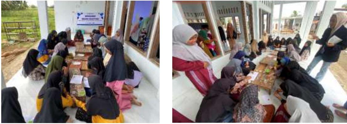
Gambar 3. Kegiatan Inti Pengenalan Alat dan Bahan Kerajinan

Kegiatan inti dimulai dengan pengenalan alat dan bahan secara mendetail. Peserta diperkenalkan dengan ragam jenis manik-manik seperti seed beads , mutiara sintetis, dan kristal ceko. Instruktur ahli mendemonstrasikan teknik dasar bead crafting , meliputi teknik simpul mati ganda untuk gelang elastis dan teknik finishing menggunakan stopper untuk kalung. Pemahaman teknis ini krusial untuk menjamin durabilitas produk.