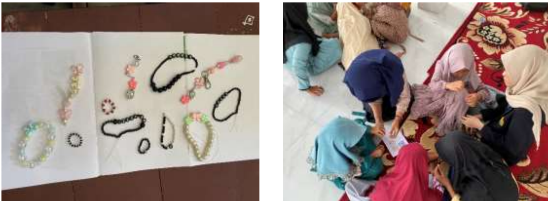
Gambar 4. Hasil Kerajinan manik-manik

Produk pertama yang dibuat adalah gelang dengan teknik dasar. Meskipun awalnya kaku, peserta perlahan mulai menemukan ritme kerja yang nyaman. Setelah itu, tantangan ditingkatkan dengan pembuatan phone strap atau gantungan HP yang sedang viral. Peserta diajarkan komposisi estetika agar strap terlihat "ramai" namun tetap harmonis secara visual.