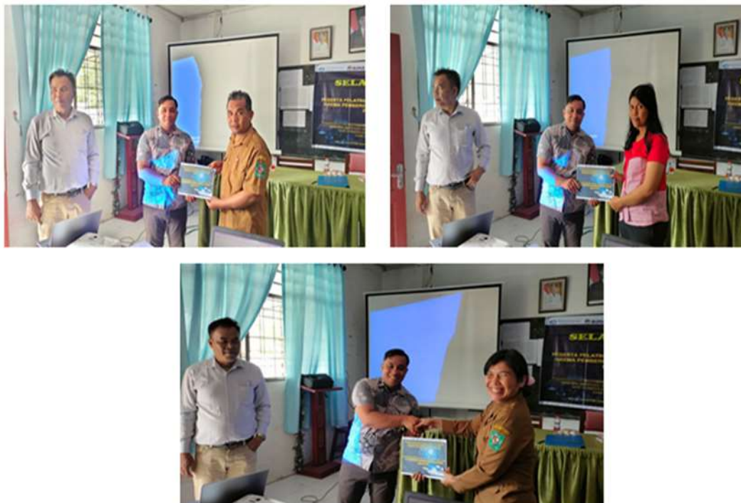
Gambar 7. Pelatihan, dan Pendampingan Berkelanjutan Inovasi Produk Tepat Guna