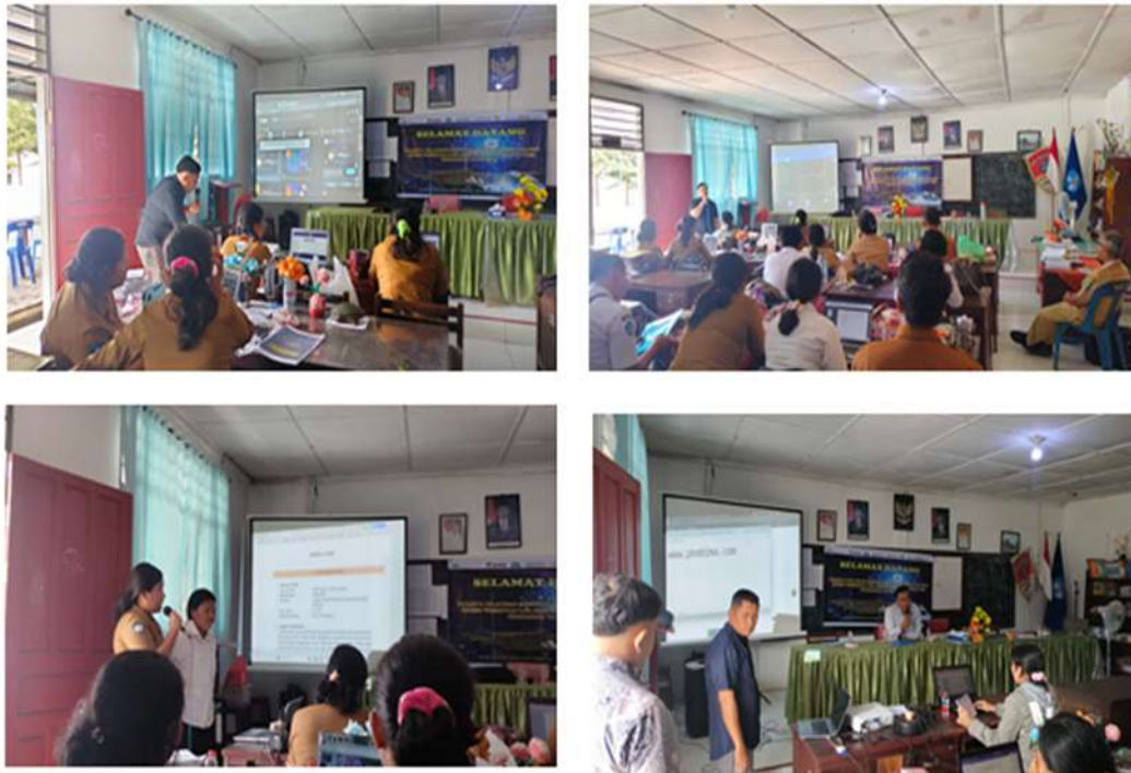
Gambar 4. Kegiatan Pendampingan Berkelanjutan PKM Hibah

pedagogik dan teknologi AI serta peserta juga akan diminta untuk mempraktekkan kembali terkait penggunaan teknologi AI dalam penyusunan modul ajar, soal-soal HOTS dan AKM, serta materi ajar yang menarik dan dievaluasi oleh narasumber dan tim PKM. Selama tahapan pendampingan berkelanjutan ini, peserta juga difasilitasi dengan modul pelatihan, materi praktik, dan tanya jawab secara tatap muka dan online melalui wa grup.