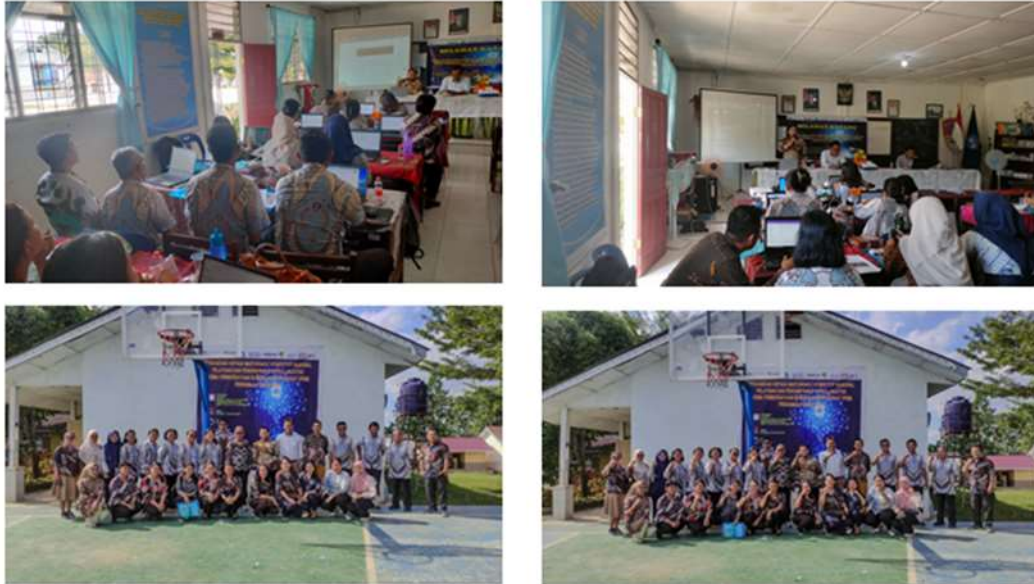
Gambar 3. Kegiatan Sosialisasi dan Pelatihan Hari Kedua PKM Hibah

(Depiani, Pujani, & Devi, 2019). Kegiatan dilanjutkan dengan sesi diskusi, tanya jawab kepada peserta. Selanjutnya, kegiatan pelatihan hari kedua diakhiri dengan pemberian posttest kepada peserta pada pukul 16.00 hingga 17.00 wib untuk mengetahui peningkatan keterampilan pedagogik dan teknologi guru melalui pelatihan AI (Sukawati, Ismayani, & Permana, 2019)