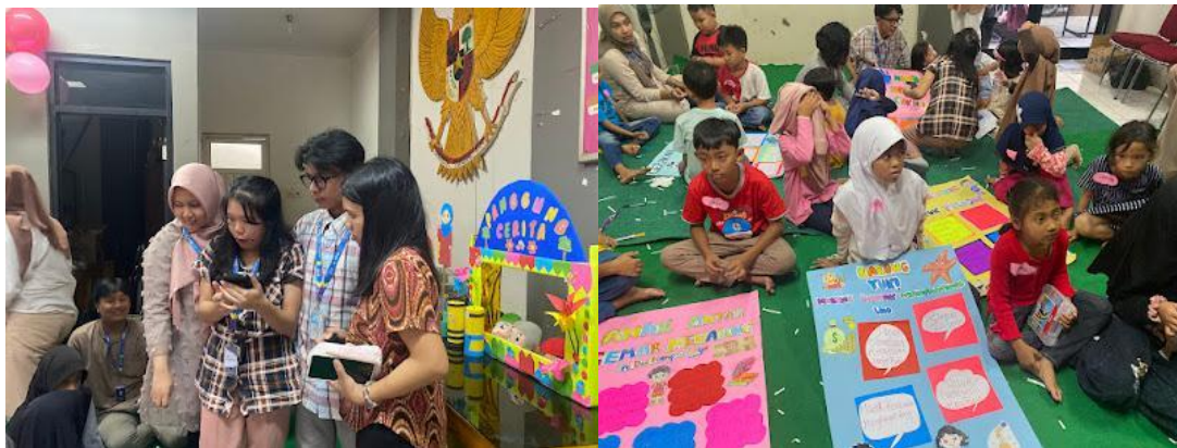
Gambar 6. Pemilihan pemegang poster terbaik