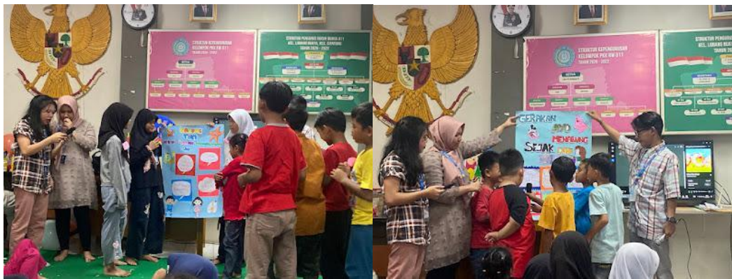
Gambar 5. Anak-anak mempresentasikan hasil poster yang sudah dibuatnya