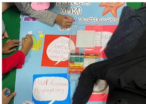
Gambar 3. Para anak-anak menyusun dan mewarnai poster