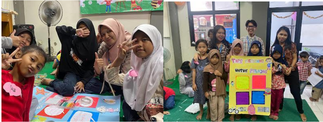
Gambar 4. Anak-anak menyelesaikan poster yang sudah dibuat