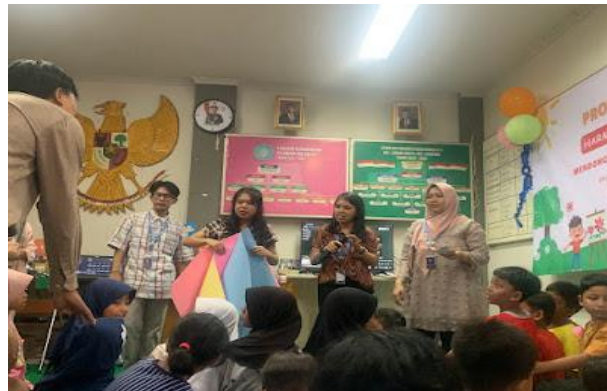
Gambar 2. Membagikan karton dan segala keperluan untuk membuat poster