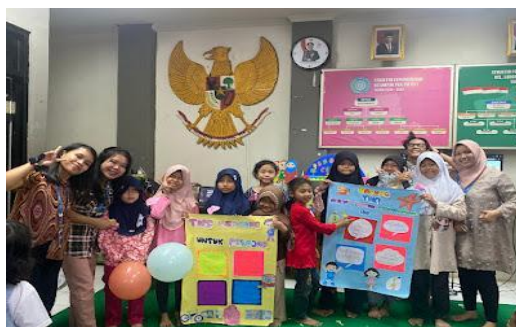
Gambar 7. Para anak yang menang poster terbaik