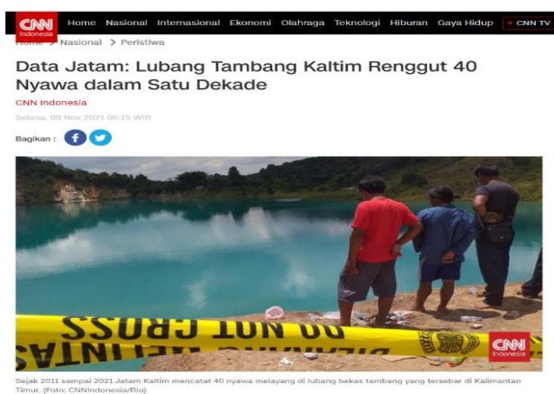
Gambar 1. Dampak Lubang Tambang yang ditutup oleh Perusahaan

Selain itu, adapun kasus yang mengakibatkan hilangnya nyawa seseorang yakni lubang tambang. Berdasarkan CNN Indonesia – Samarinda, bahwa data dari Jaringan Advokasi Tambang (Jatam) Kalimantan Timur mencatat bahwa hilangnya 40 nyawa manusia baik anak-anak, remaja hingga dewasa selama satu dekade diakibatkan karena adanya lubang bekas tambang (Rio, 2021).