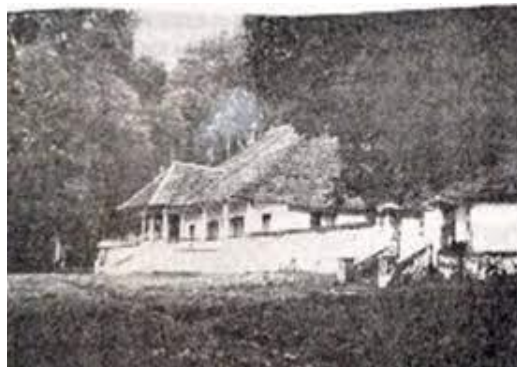
Arsip Gambar : Klenteng Boen Tek Bio Tahun 1684

Pada tahun 1684 inilah pertama kali Klenteng Boen Tek Bio didirikan. Para kongsi dagang tersebut yang di dalamnya terdapat perkampungan dari Petak Sembilan yang secara gotong royong mengumpulkan dana untuk bantuan pendirian dari Klenteng Boen Tek Bio itu sendiri. Disini, bentuk dalam pendirian klentengnya masih sangatlah sederhana sebagaimana masih terbuat dari tiang bambu dengan beratap rumbia.