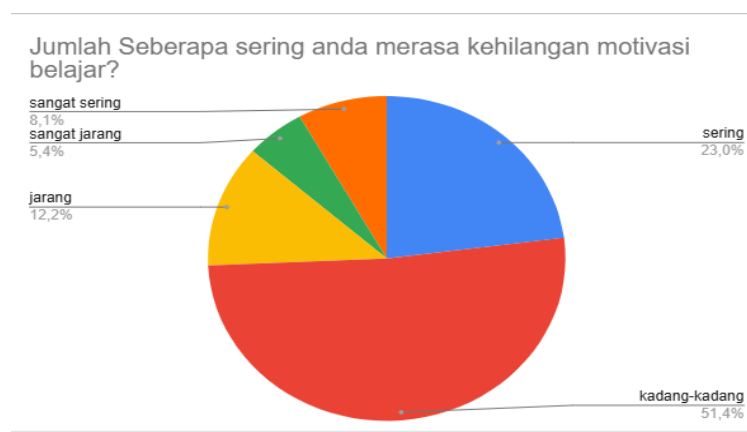
Gambar 1. Grafik kusioner data motivasi belajar siswa SMAN 13 Surabaya

Motivasi dalam belajar tentunya sangat diperlukan siswa karena siswa yang memiliki motivasi tinggi dapat membuat siswa lebih terlibat dalam proses belajar, mereka akan cenderung aktif berpartisipasi, bertanya dan mencari informasi tambahan. Namun jika siswa tidak memiliki motivasi yang tinggi hal tersebut tentunya dapat menghambat siswa fokus dalam proses pembelajaran karena siswa yang tidak termotivasi cenderung kurang aktif dalam proses pembelajaran, dan hal tersebut juga dapat mengakibatkan siswa tidak bisa optimal dalam mengembangkan pengetahuannya dalam aspek akademik mereka. Adapun dari SMAN 13 Surabaya sendiri disekolah tersebut masih ada beberapa siswa yang terkadang masih kehilangan motivasi belajar, adapun hal tersebut dapat kita lihat dari data sebagai berikut :