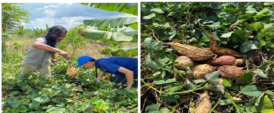
Gambar 1. Panen Ubi Ungu