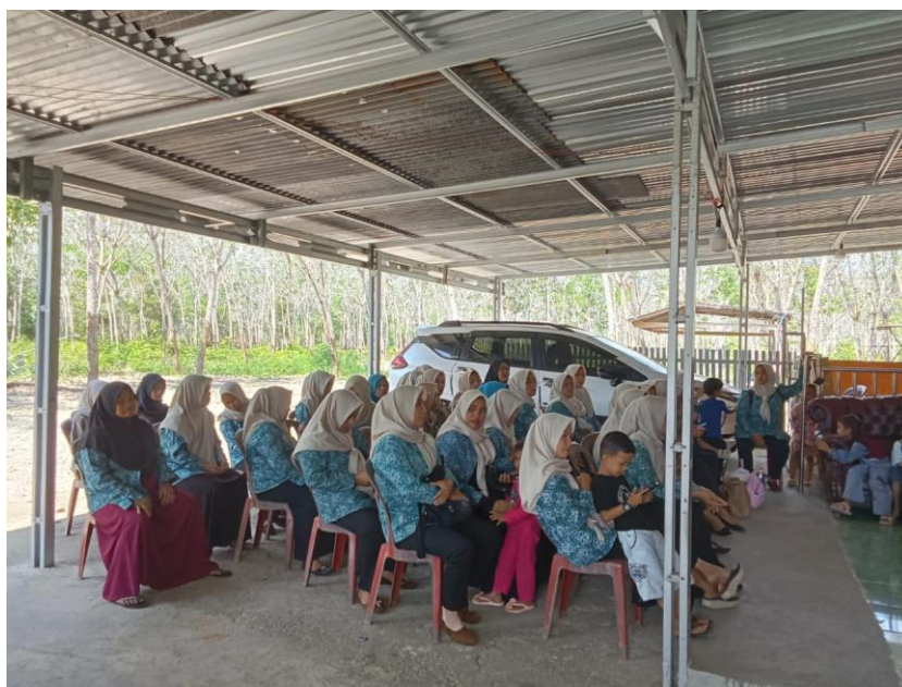
Gambar 3. Sosialisasi “Pengolahan Tepung Ipomea batatas ”

Kegiatan ini diawali dengan tim melakukan observasi untuk mengetahui kebutuhan desa, permasalahan, dan solusi yang bisa ditawarkan. Setelah dilakukan observasi dan wawancara, langkah selanjutnya tim melakukan sosialisasi dengan masyarakat desa Embacang Baru (Gambar 3). Setelah melakukan sosialisasi, tim memberikan soal pretes untuk mengetahui tingkat keterampilan masyarakat (Husna & Saputri, 2022). Pada pertemuan selanjutnya, tim memberikan pengetahuan awal serta mendemonstrasikan keterampilan yang akan diterapkan dalam kegiatan ini.