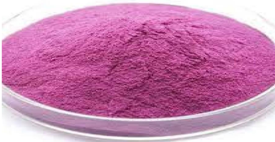
Gambar 5. Tepung Ipomea batatas

Pada saat kegiatan pembuatan tepung Ipomea batatas , selain antusias, keterampilan masyarakat juga mengalami peningkatan (Gambar 6).