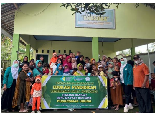
Gambar 2: Penyuluhan

Untuk memastikan keberlanjutan program edukasi ini, kader Posyandu turut dilibatkan dalam penyampaian materi. Pelibatan kader bertujuan agar mereka memperoleh pemahaman yang lebih mendalam mengenai Buku KIA dan cara penggunaannya, sehingga dapat melanjutkan edukasi kepada masyarakat secara mandiri setelah program ini selesai. Dengan adanya kader yang berperan sebagai agen edukasi di komunitas, diharapkan informasi mengenai pemanfaatan Buku KIA dapat terus disebarluaskan secara luas dan menjadi bagian dari praktik kesehatan yang berkelanjutan di masyarakat.