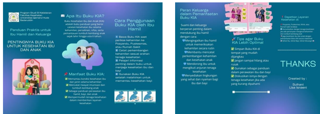
Gambar 1: Leaflet

Dengan adanya leaflet ini, diharapkan peserta penyuluhan tidak hanya dapat memahami materi dengan lebih baik selama kegiatan berlangsung, tetapi juga memiliki bahan referensi yang dapat digunakan kembali di rumah. Keberadaan media edukasi ini diharapkan dapat meningkatkan keberlanjutan pemanfaatan Buku KIA serta mendorong ibu hamil dan keluarganya untuk lebih aktif dalam menjaga kesehatan ibu dan anak secara mandiri.