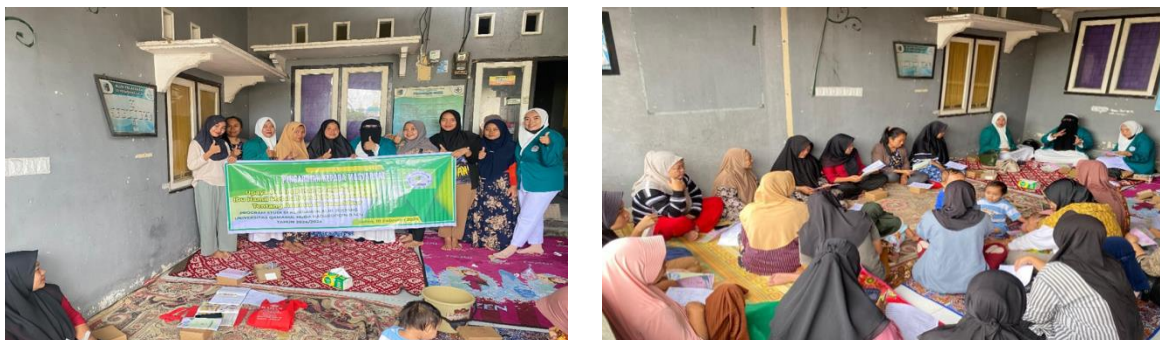
Gambar 1. Kegiatan penyuluhan di Poskesdes desa Sikur

Output yang diharapkan adalah terbentuk kelompok masyarakat (Kader Posyandu) yang akan bertugas dalam melakukan pencegahan dan deteksi dini anemia pada ibu hamil.