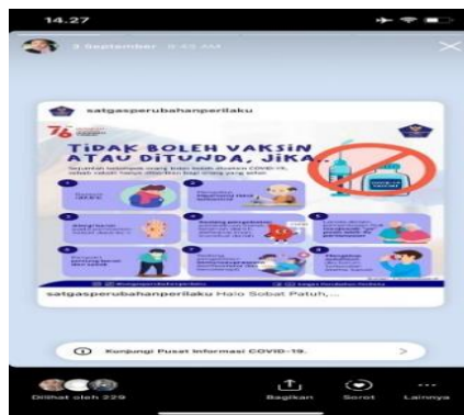
Gambar 2. Infografis yang disebar di media sosial instagram

Berdasarkan hasil kegiatan penyebaran infografis terdapat beberapa respon dari warga net yang berada di Instaram. menandakan, bahwa mereka tertarik dengan infografis tersebut dan berminat untuk menyebarkan infografis kepada teman dan saudaranya. Hal ini menunjukkan bahwa individu tersebut mendapatkan pemahaman dari infografis yang disebarkan serta memiliki niat atau intensi untuk bertindak dengan menyebarkan kembali infografis tersebut. Dilihat dari banyaknya viewers yang melihat infografis yang disebarkan menunjukkan bahwa infografis, dapat memberikan pemahaman yang lebih mudah serta lebih menarik untuk dibaca, dibandingkan informasi yang berbasis teks. Selain itu, dengan banyaknya viewers yang melihat infografis, menjadikan banyaknya masyarakat yang teredukasi akan pentingnya kesehatan di masa pandemi Covid-19.